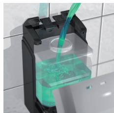
RÉDUCTEUR DE DÉBIT